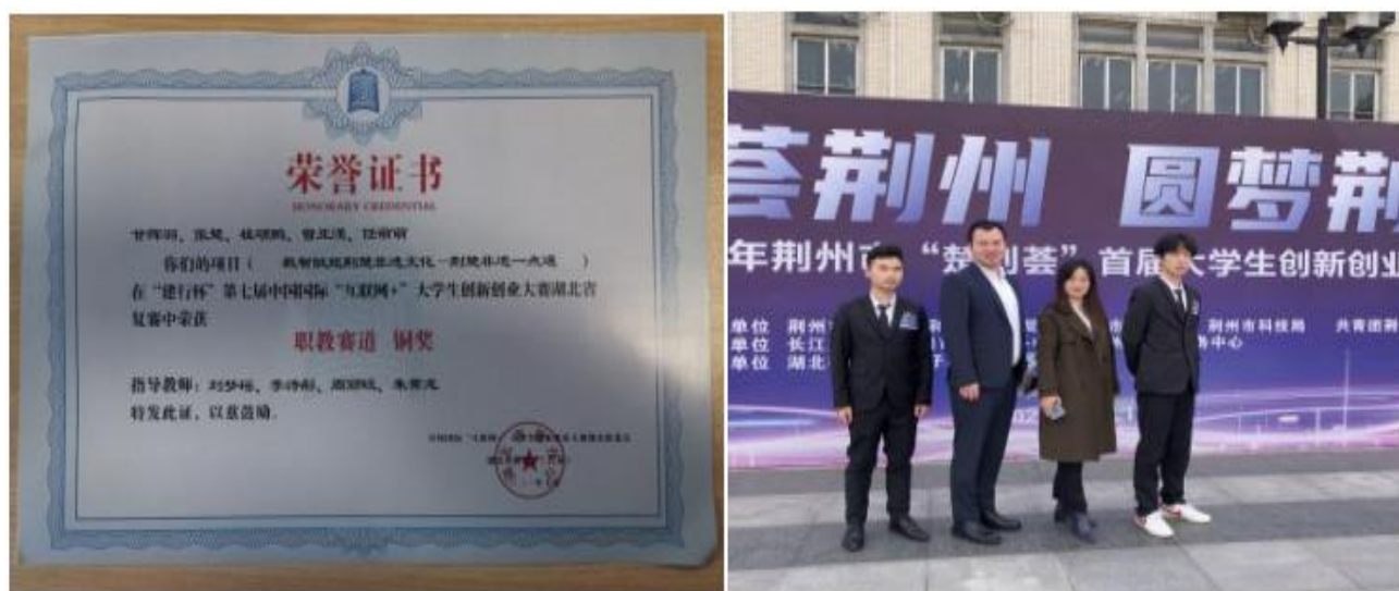
图4 第七届国际“互联网+”大学生创新创业大赛获职教赛道湖北省铜奖、荆州市“楚创荟”首届大学生创新创业大赛职教赛道一等奖

职业素质课程进课堂,坚持“创业带动就业”。开设大学生职业指导课程,把学生求职技巧通过以赛代学、以赛代练的方式植入课堂,认真学习贯彻湖北省关于“创新创业”方面的各项精神,促进大学生创新创业教育改革。通过多种形式开设各类创新创业课程,创业指导及实训类课程,并开设“创业实验班”选拔孵化更多创新创业项目。2021年首次参加第七届国际“互联网+”大学生创新创业大赛中,并获职教赛道湖北省铜奖;参加荆州市“楚创荟”首届大学生创新创业大赛职教赛道一等奖并被推荐到“宜荆荆恩”人福杯大学生创新创业大赛的总决赛。选拔培养50名“明日创业之星”,组建了“创业实验班”,专人指导,重点孵化创业项目。2021届毕业生自主创业比例为0.3%。