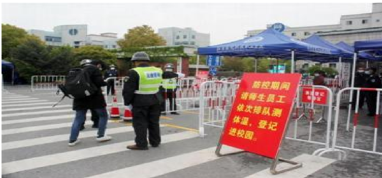
图11 门卫严格疫情防控，管控人员进出