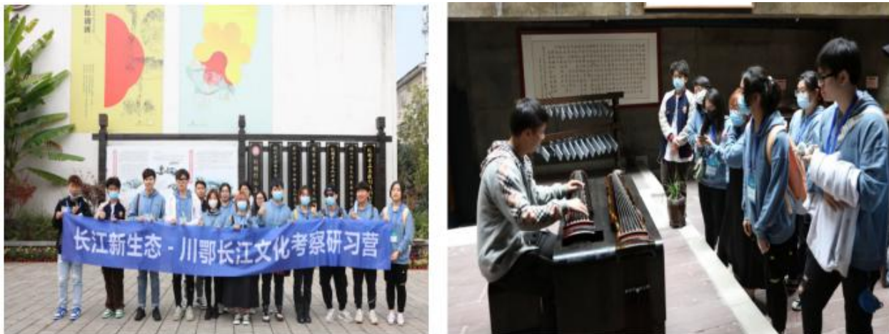
图10 四川大学港澳班“长江新生态·川鄂长江文化考察研习营”走进我院非遗传承院

2021年10月，四川大学港澳班“长江新生态·川鄂长江文化考察研习营”走进我院非遗传承院，感受荆楚文化魅力，领略民间匠人精湛技艺。在参观之前，长江大学楚文化研究院教授孟修祥在学术报告厅为同学们带来了关于楚文化的讲座，让同学们带着对于楚文化的无限想象在传承院中探寻。