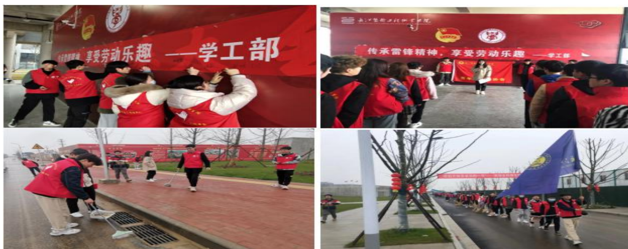
图2 学生开展劳育实践活动