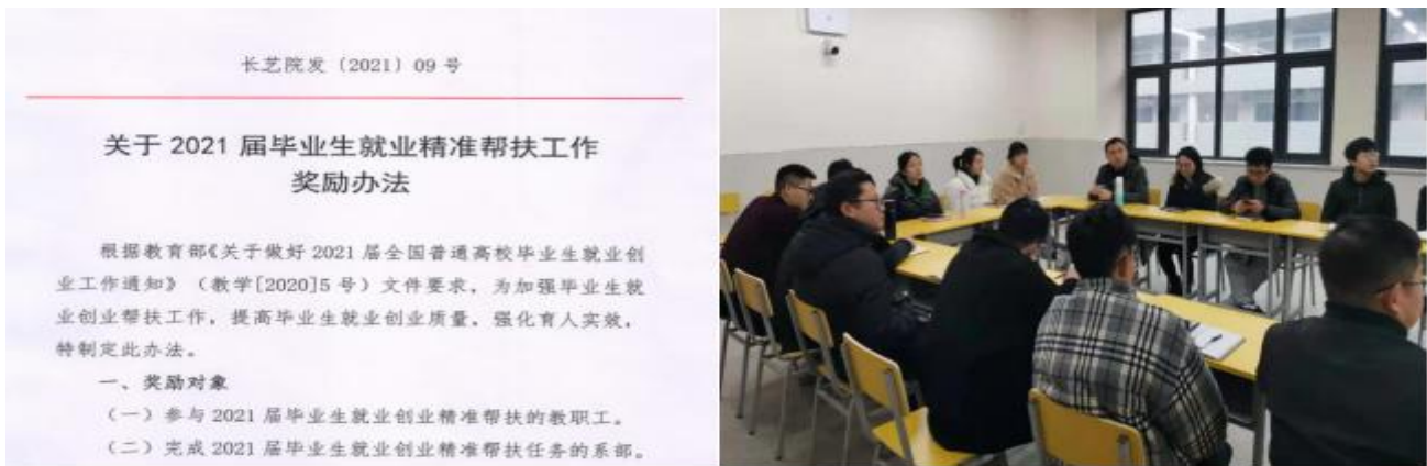
图3 学校就业帮扶有关文件及一对一就业帮扶会现场