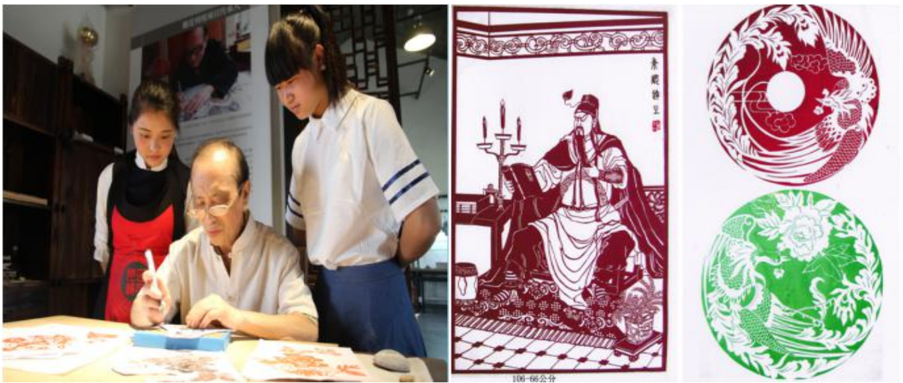
图1 学生在工坊学习荆楚非遗手工技艺

非遗课程的开设是弘扬和传承传统文化的重要举措，是实现立德树人的有效途径，是培养学生爱国主义精神，对增强学生民族自豪感、责任感，树立文化自信具有不可估量的价值和意义。