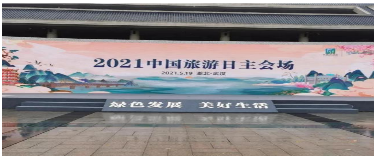
图10 参加2021年“中国旅游日”

文化和旅游部副部长杜江，省委常委、宣传部长许正中等领导对我院展出的文创产品十分关注，就制作工艺和产品市场等方面进行了交流。