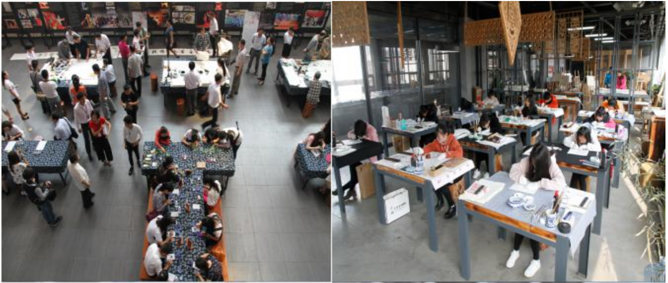
图17 荆楚非遗传承院对社区开放体验及接待中小学生学习