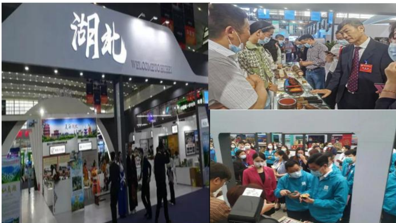
图9 参加第五届丝绸之路国际博览会