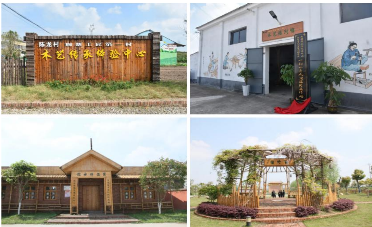
图16 学院在沙市陈龙村挂牌“一村一匠乡村人才振兴工作站”