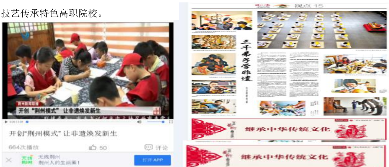
图5学院全力打造荆楚非遗传承和创新等2个高水平专业群

根据湖北省高水平高职学校建设标准，以立德树人为根本，建设荆楚非遗工匠小镇、汽车循环经济产业学院，打造传统工艺、汽车循环经济高职教育样板。到2023年，学校建成湖北省内特色鲜明的高水平高职学校，荆楚非遗文化传承与创新专业群等2个重点专业群建设成特色鲜明、湖北领先的高水平专业群，实现人才培养质量新提升、人才培养模式新突破、专业结构布局新优化、服务文化发展新贡献，在办学理念与模式、专业与课程建设、教学创新团队建设和人才培养、教育信息化和国际化等方面取得较大突破，形成职业教育+非遗文化传承创新+产业开发的“长艺方案”，努力建设特色鲜明、省内一流、全国有影响的非遗技艺传承特色高职院校。