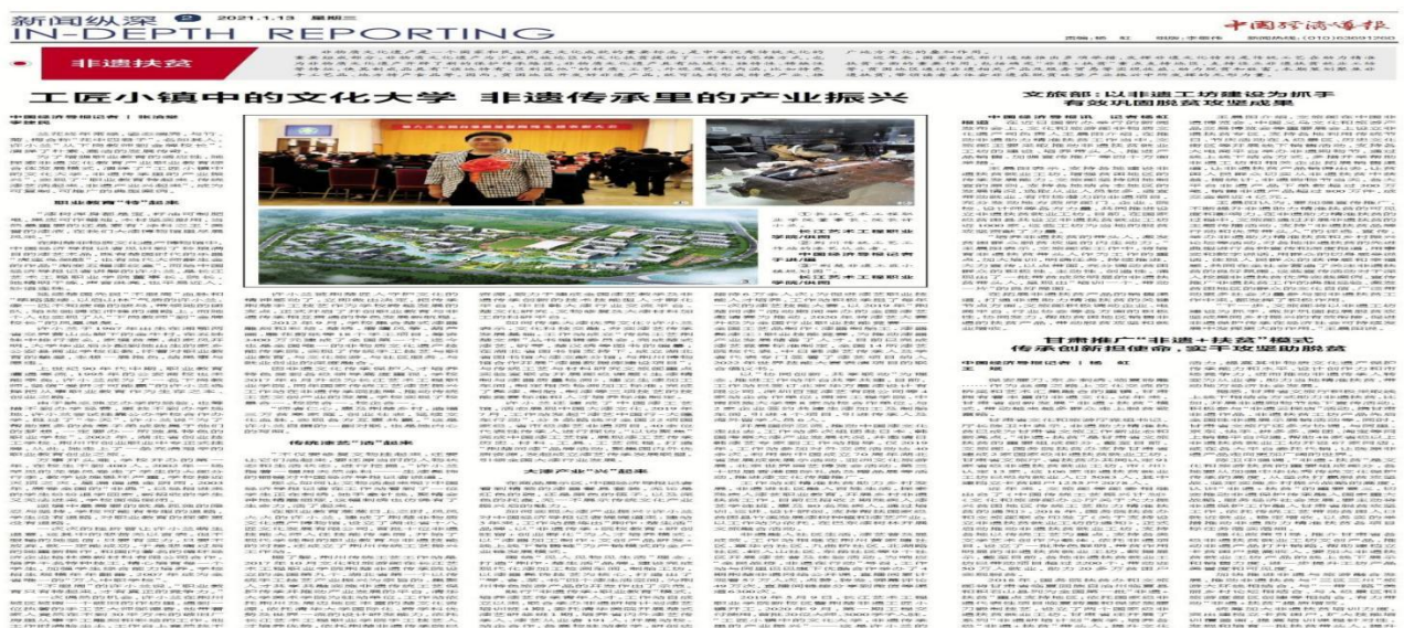
图18 中国经济导报以《工匠小镇中的文化大学 非遗传承里的产业振兴》报道学院

学校新校区2020年9月投入使用，整个校区分为核心区、教学区、交流区、生活区、实训区、双创区等6大部分，规划有学术交流中心、职业实训中心、漆博物馆、古琴剧场等25个配套项目。新校区将秉持“工匠小镇，非遗大学”的理念，搭建文创产业招商平台，建设现代职业学院，将非遗传承融入职业教育，探索“职业教育+非遗文化传承+文旅产业开发”融合发展的办学模式，中国经济导报2021年1月以专版报道学院。